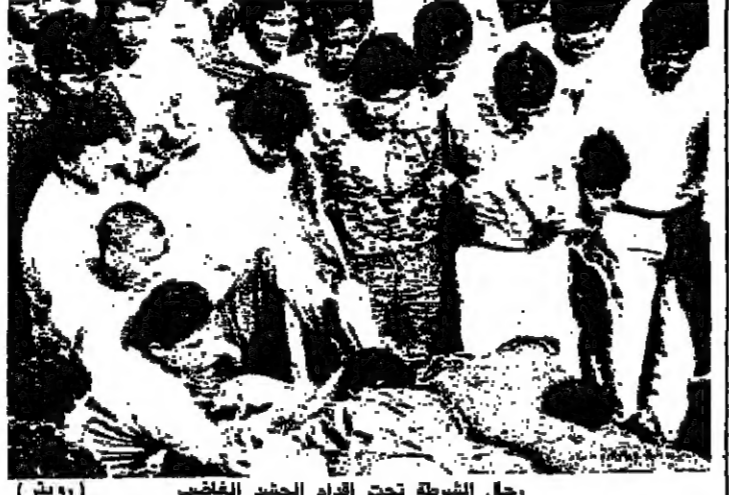
رجال الشرطة تحت اقدام الحشد الغاضب

اكد شعوب نيبال ان اربعة اشخاص قتلوا امس في كاتماندو حين اطلقت الشرطة النار على المتظاهرين الغاضبين الذين ضربوا اثنين على الاقل من رجال الشرطة حتى الموت في اعمال شغب اجتاحت المدينة. وقال راديو نيبال الرسمي ان حشد من رجال الشرطة اقتحموا شوارع كاتماندو امس في اعمال شغب اجتاحت المدينة. واستخدمت مثلثات التيجان النابيد في اغلاق الطريق الذي ضرب فيه الحشد افراد الشرطة. وقال شعوب نيبال ان ٢١ شرطياً على الاقل تعرضوا لضرب في عدة محلات في العاصمة على ايدي المواطنين الذين اتهموه بمحاولة نهب المئات والمتاجر. وزعم المواطنون ان رجال الشرطة اعتدوا بان تصول للكنيسة المتسودين فدفعوا لهم مبالغ مالية ليشوهوا صورة الحكومة الجديدة. كما اجبرت حشود ضخمة وزير الداخلية بوج باراساد اوبدي على ان يتراجع عن اقراره في البرلمان الذي اتهم فيه رجال الشرطة في ما يتعلق بمصرع عشرات الاشخاص اثناء حملة المطالبة بالديمقراطية.